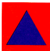
Fig. 4 : Triangle bleu sur fond orange

Le signe distinctif international de la protection civile, prévu à l'article 66, paragraphe 4, du Protocole est un triangle équilatéral bleu sur fond orange. Il est représenté à la figure 4 ci-après :