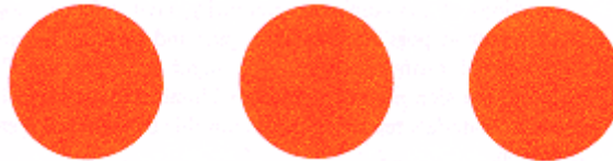
Figure 5. Signe spécial international pour les ouvrages et installations contenant des forces dangereuses

4. De nuit ou par visibilité réduite, le signe pourra être éclairé ou illuminé; il pourra également être fait de matériaux le rendant reconnaissable par des moyens techniques de détection.