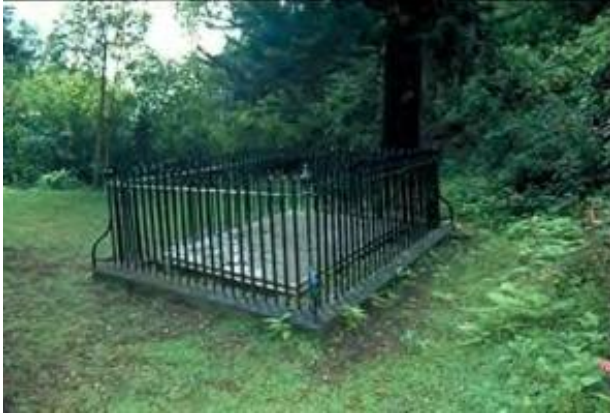
La tombe de Sainte Hélène