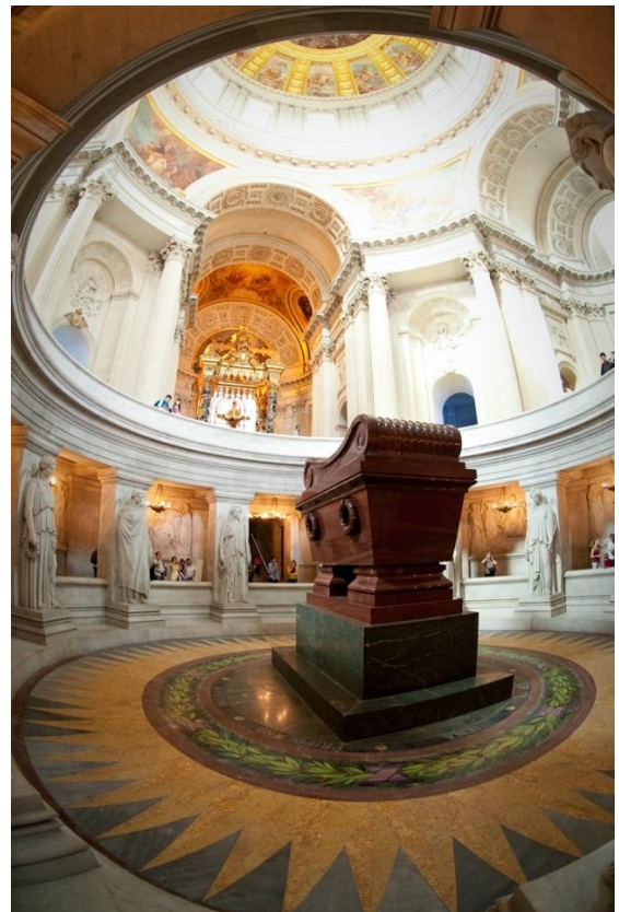
Les Invalides, le tombeau