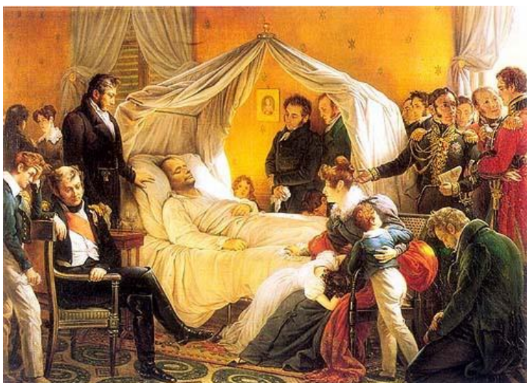
Lit de mort