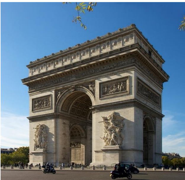
Arc de Triomphe

Le 15 octobre, on procède à l'exhumation et ouverture de la bière. Le corps de Napoléon est étonnamment conservé. Analyses faites de ses cheveux, ils contiennent 3 000 fois le taux d'arsenic normal (selon les Anglais, dû au caractère granitique de la tombe, mais quand même 3 000 fois !!!). Le 18 octobre, corps transféré dans un sarcophage de plomb, les navires français appareillent pour Cherbourg. Le 30 novembre, transfert vers un vapeur, le Normandie, qui remonte la Seine jusqu'à Rouen, puis la « Dorade » un vapeur plus léger jusqu'au pont de Neuilly.