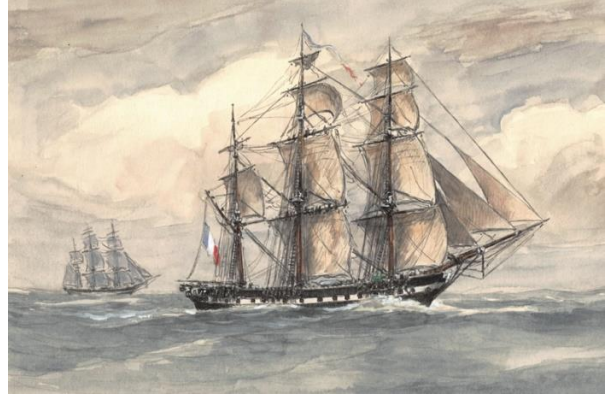
La Belle Poule

Le 15 octobre, on procède à l'exhumation et ouverture de la bière. Le corps de Napoléon est étonnamment conservé. Analyses faites de ses cheveux, ils contiennent 3 000 fois le taux d'arsenic normal (selon les Anglais, dû au caractère granitique de la tombe, mais quand même 3 000 fois !!!). Le 18 octobre, corps transféré dans un sarcophage de plomb, les navires français appareillent pour Cherbourg. Le 30 novembre, transfert vers un vapeur, le Normandie, qui remonte la Seine jusqu'à Rouen, puis la « Dorade » un vapeur plus léger jusqu'au pont de Neuilly.