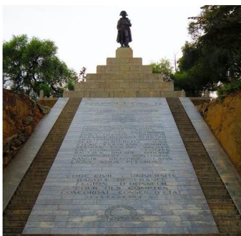
Monument du Casone