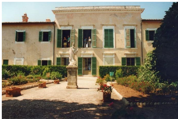
Villa des Moulins, Ile d'Elbe

Mais il fallait que le destin s'accomplisse. Les coalisés ne l'avaient exilé sur l'île d'Elba, si près de la France et de l'Italie que pour qu'il soit tenté de s'en échapper, ce qui permettra de le déclarer parjure. Ce sera l'épopée des Cent jours, de Golfe Juan à Paris (la vraie route Napoléon, pas la RN 7...).