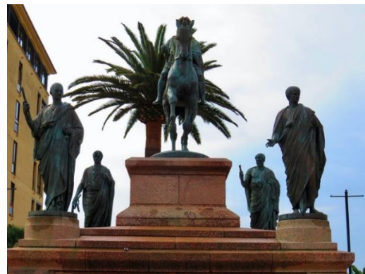
Napoléon et ses frères

On a une trace officielle des Bonaparte en Corse dès son arrière-grand-père, né lui-même à Ajaccio. La famille est issue d'une lignée « Buonaparte » de petite noblesse florentine dont on trouve trace dès le 12 em siècle, à laquelle elle reste attachée. Charles Bonaparte fera valoir ces titres quand il inscrira ses fils dans les écoles royales.