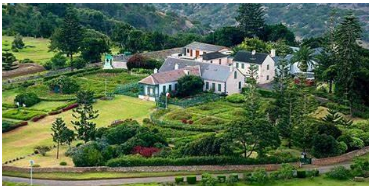
Maison de Longwood

Napoléon, que l'on ne nomme plus que « général Bonaparte » devra subir la tyrannie de son geôlier, Hudson Lowe. La garnison comporte 3 000 hommes et 3 bâtiments croisent en permanence au large. Cette fois, il ne fallait plus qu'il s'échappe.