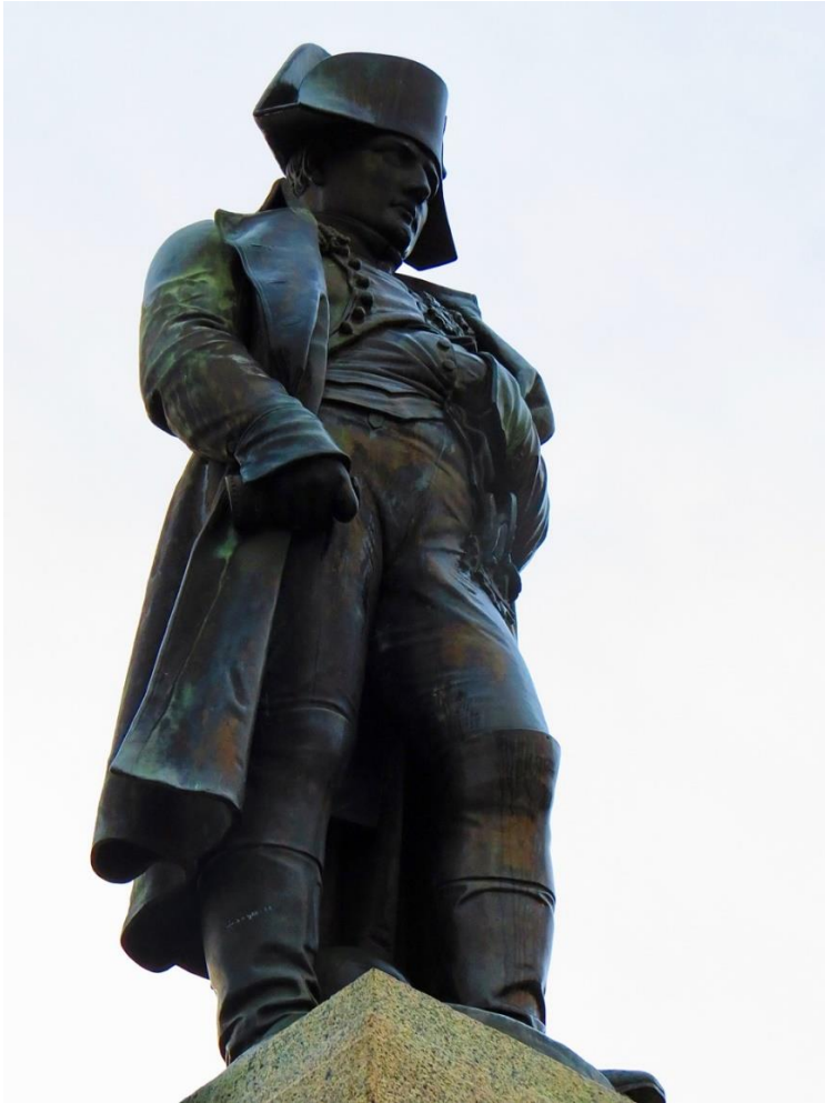
Napoléon au Casone