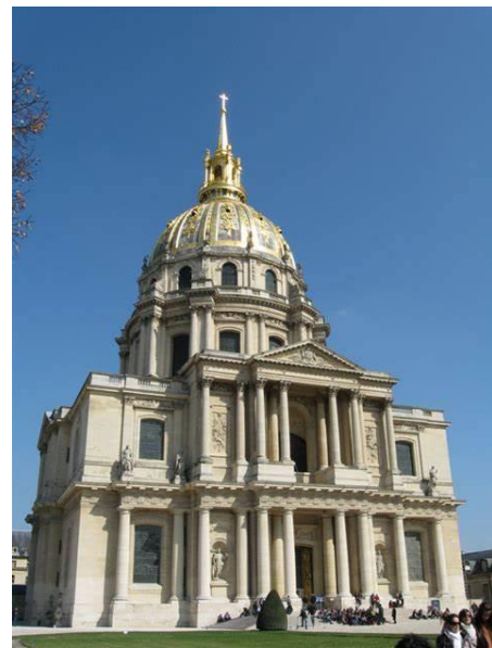
Dôme des Invalides